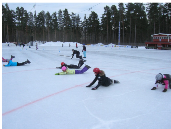
Elever från Kyrkskolan i Stora Tuna åker tågstaffett och Tunets skolbarn testar att åka säl.